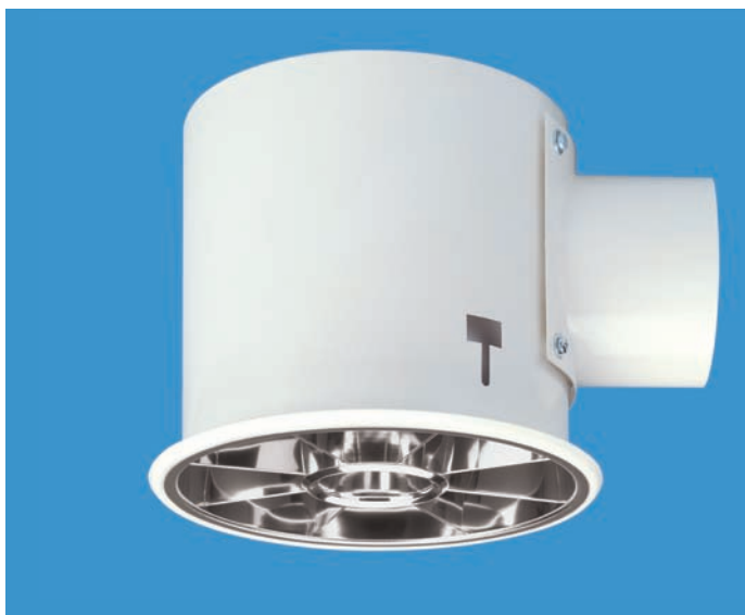
LEDA 1/2 Abluftleuchten