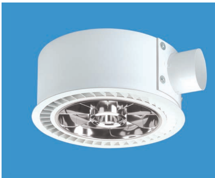
LEDA 1/1 Zu- und Abluftleuchten