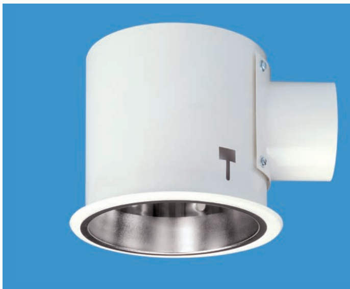
LEDA 1/3 Abluftleuchten